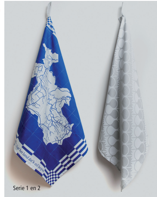
Serie 1 en 2

Serie 2 Deze serie theedoeken informeert de gebruiker over de schatten die Overijssel rijk is, maar waarmee veel mensen nog niet bekend zijn. Voor de ontwikkeling is er eerst onderzoek verricht naar de mogelijke te abstraheren iconen van Overijssel. De door ons gekozen iconen zijn niet voor iedereen meteen herkenbaar als typisch Overijssels, wat het ontwerp een educatieve waarde geeft. Zo kozen wij voor de iconen van de kievitsbloem, de zouttoren en het stiepelteken en hebben we deze door repeterende patronen getransformeerd naar de dessins. Door middel van labels wordt de gebruiker geïnformeerd over de serie (serienummer) en de specifieke culturele achtergrond van de gebruikte Overijsselse iconen.